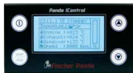
Panda iControl digitalni pokazivač